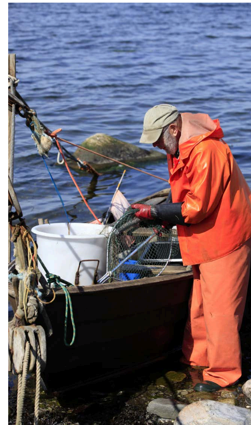
Förstudie: Rädda Kustfisket